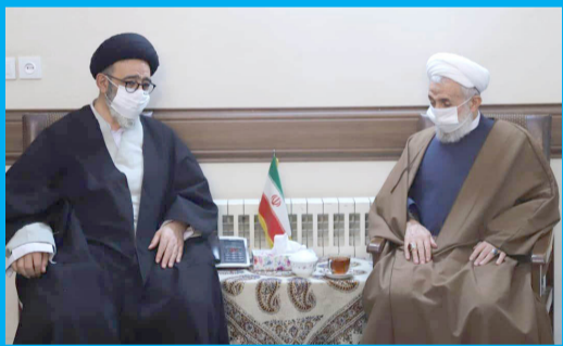
دیدار حضرت آیت الله صدیقی امام جمعه موقت تهران و دبیر ستاد امر به معروف و نهی از منکر و رئیس حوزه علمیه امام خمینی (ره) تهران با نماینده ولی فقیه در استان و امام جمعه تبریز