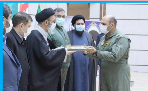
آیین تکریم و معارفه فرماندهی پایگاه هوایی شهید فکوری با حضور نماینده ولی فقیه در استان و امام جمعه تبریز و فرمانده نیروی هوایی ارتش جمهوری اسلامی ایران