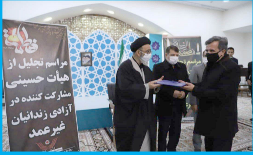
مراسم تجلیل از هیئت‌های فعال در آزادسازی زندانیان غیر عمد تبریز با حضور نماینده ولی فقیه در استان و امام جمعه تبریز