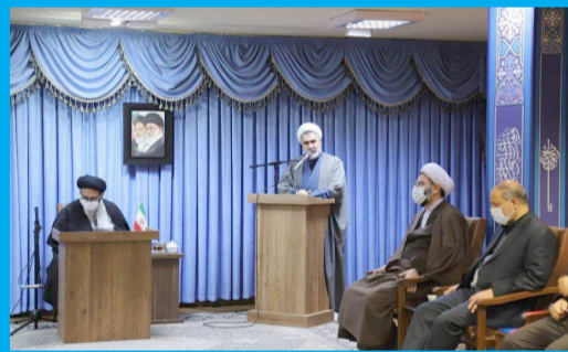
دیدار اعضای بنیاد بین المللی غدیر با نماینده ولی فقیه در استان و امام جمعه تبریز