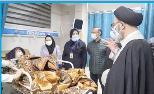
حضور نماینده ولی فقیه در استان و امام جمعه تبریز در بیمارستان امام رضا (ع) تبریز و عیادت از سانه دیدگان و مصدومان ساختمان مسکونی فروریخته در خیابان شهید بهشتی محله عباسی