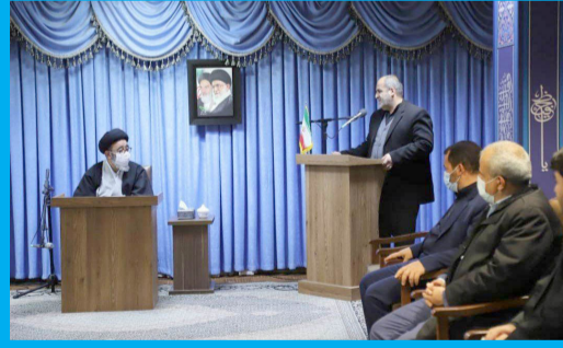
دیدار مدیران و کارکنان سازمان مدیریت پسماند شهرداری تبریز با نماینده ولی فقیه در استان و امام جمعه تبریز