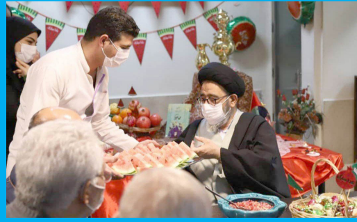
نماینده ولی فقیه در استان و امام جمعه تبریز هم‌زمان با شب یلدا با حضور در یکی از آسایشگاه‌های تبریز با سالمندان عزیز دیدار و گفتگو کردند